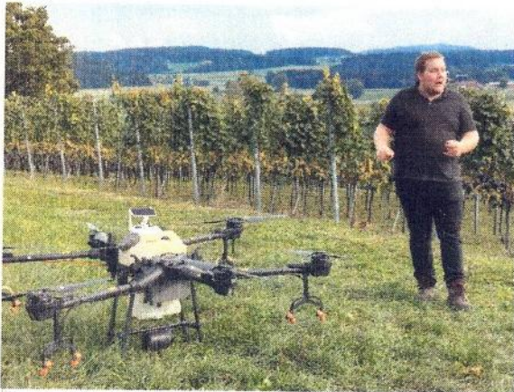
Drohnen-Demo mit Reben-Spritzbrühe